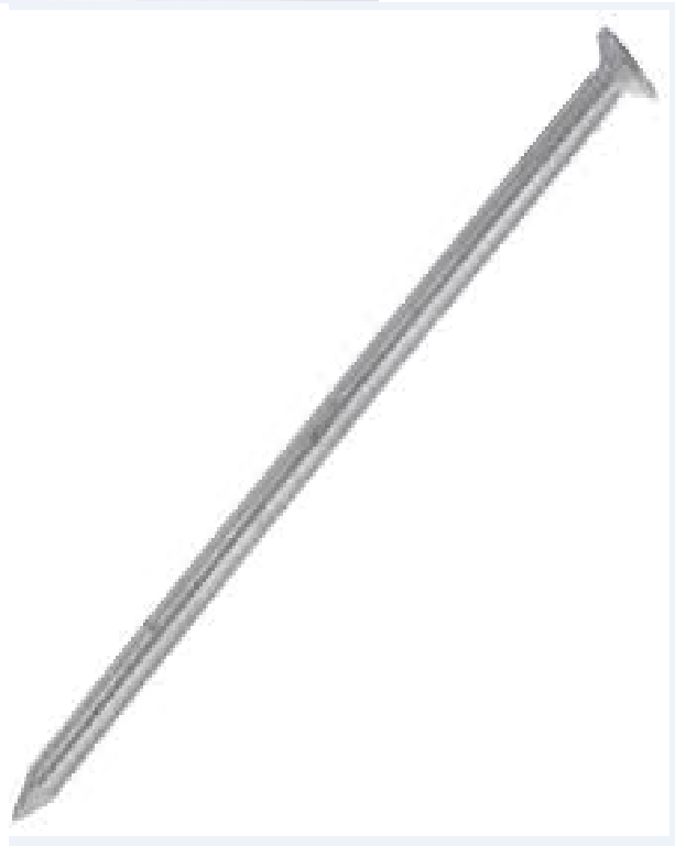
Kuva: taottu paanukatenaula ja tavallinen teräslankanaula.