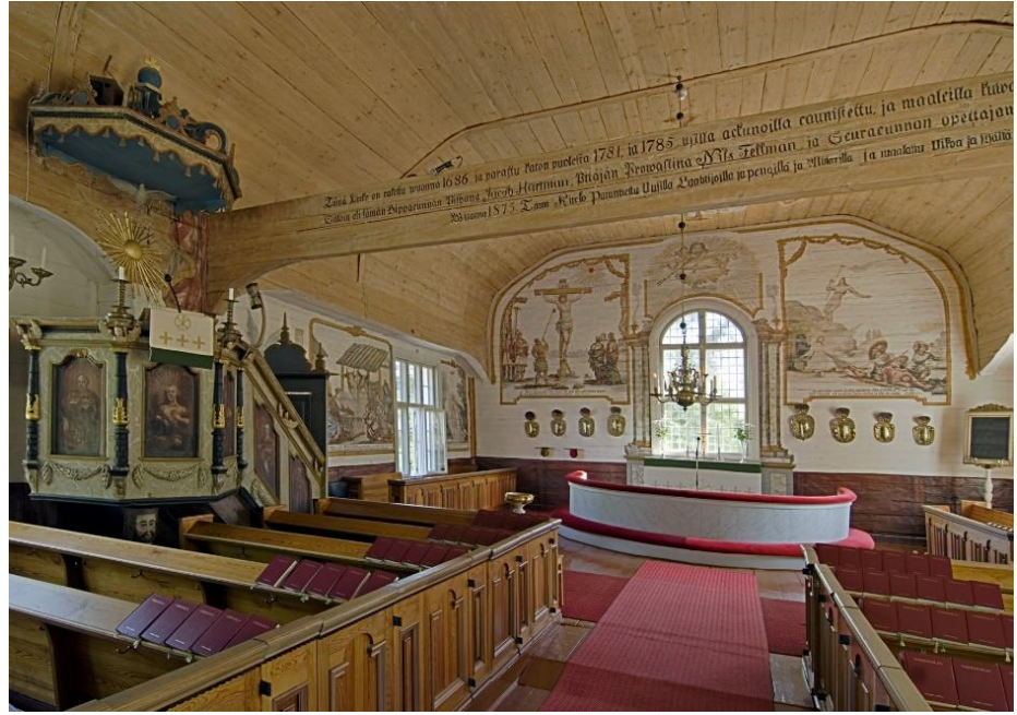
Vanha kirkko, kirkkosali.