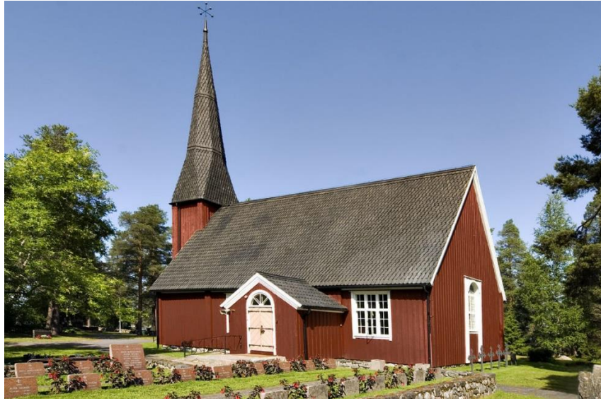
Vanha kirkko ja sankarihauta-alue, kuva Seppo Sivonen