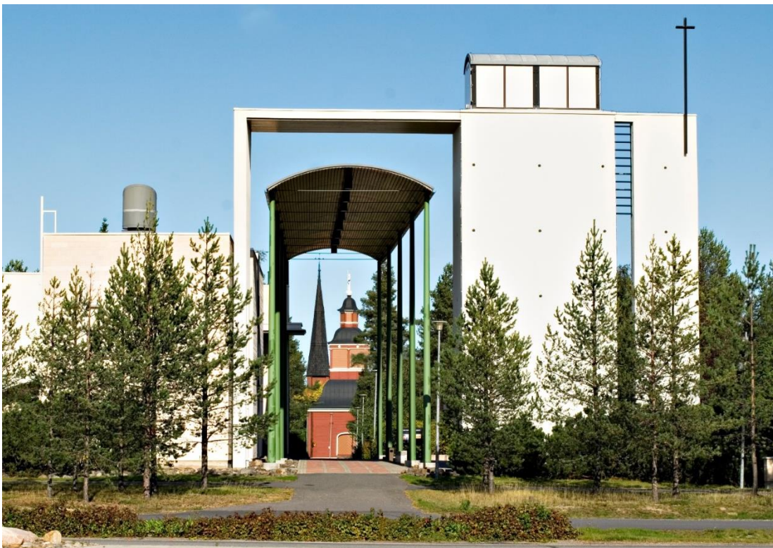
Pyhän Kolminaisuuden kirkko, Vanha kirkko ja kellotapuli.

Uusi Pyhän Kolminaisuuden kirkko yhdistyy vanhaan miljööseen kirkon sisääntulokatoksen valedisperspektiivin rajaamana elementtinä.