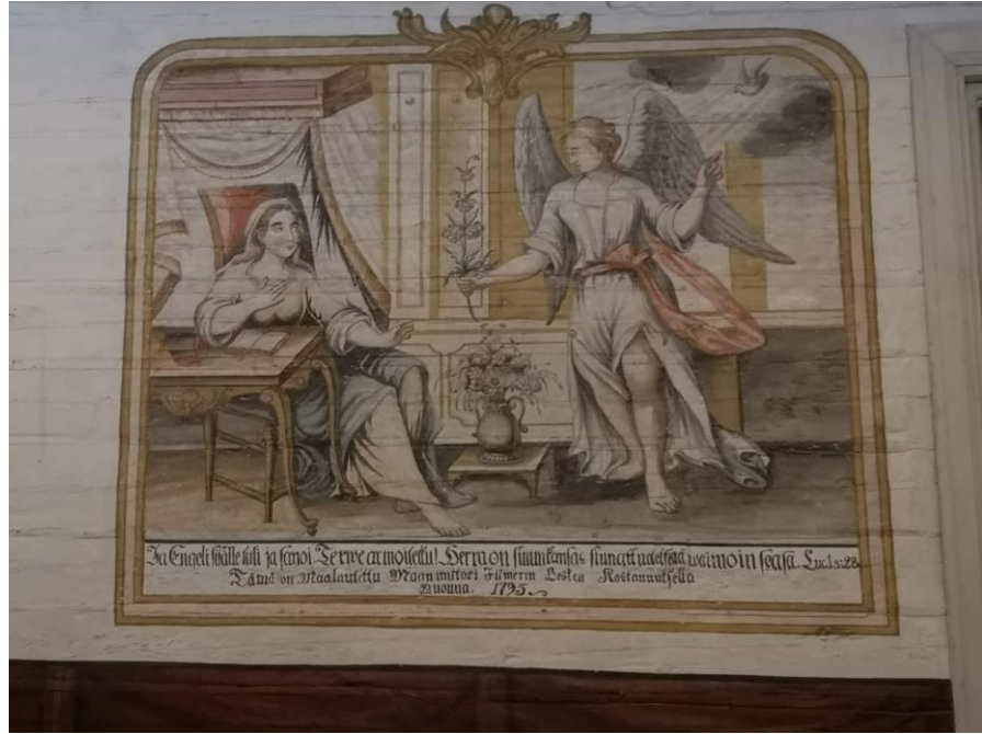
Ristiltäotto ja Marian ilmestys -maalaukset.

Valaistussuunnittelussa on kiinnitetty erityistä huomiota Vanhan kirkon sisä- ja ulkovalaistukseen niin, että valaistus luontevalla tavalla tukisi kirkossa järjestettäviä tilaisuuksia, alueella tapahtuvaa yleistä liikkumista ja alueeseen liittyvää valvontaa.