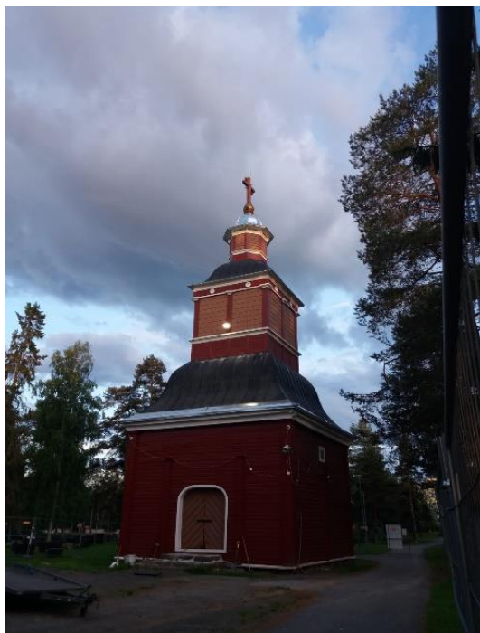
Vanhan kirkon kellotapuli, kuva Anneli Salo

Vanhan kirkon, sen kellotapulin ja kirkonmäen aluetta koskeva restauroiva kunnostustyö nimettiin seurakunnan toimesta vuonna 2016 Kirkonmäkihankkeeksi. Kirkkovaltuusto hyväksyi hankekokonaisuutta